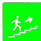
Scala di emergenza

L' Appaltatore attesta, sottoscrivendo l'apposita dichiarazione inviatagli dal Committente, di aver letto ed approvato le misure di prevenzione predisposte e di aver informato e formato i propri lavoratori sul contenuto del presente documento; si impegna inoltre ad attuare tutte le misure di prevenzione necessarie al fine di ridurre al minimo i rischi derivanti dall'attività oggetto dell'appalto.