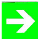
Percorso di emergenza