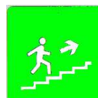
Scala di emergenza

L' Appaltatore attesta, sottoscrivendo l'apposita dichiarazione inviatagli dal Committente, di aver letto ed approvato le misure di prevenzione predisposte e di aver informato e formato i propri lavoratori sul contenuto del presente documento; si impegna inoltre ad attuare tutte le misure di prevenzione necessarie al fine di ridurre al minimo i rischi derivanti dall'attività oggetto dell'appalto.