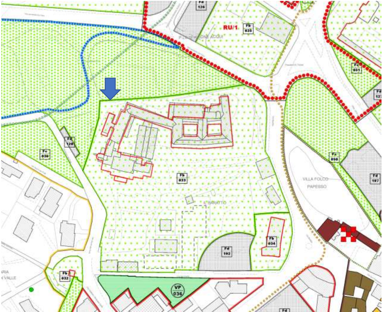
ESTRATTO PIANO ININTERVENTI